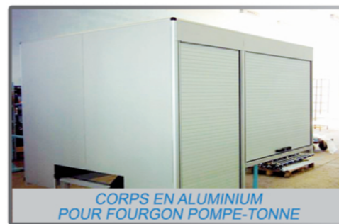
CORPS EN ALUMINIUM POUR FOURGON POMPE-TONNE