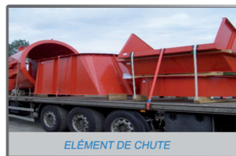
ELÉMENT DE CHUTE