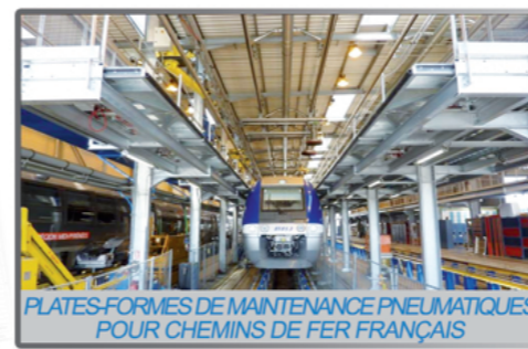
PLATES-FORMES DE MAINTENANCE PNEUMATIQUES POUR CHEMINS DE FER FRANÇAIS

Fabricant de constructions en acier depuis 1974.